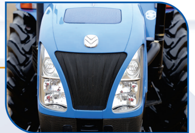
CAT आई हेडलैम्प