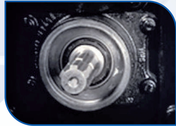
इकोनॉमी, रिवर्स और ग्राउंड स्पीड PTO