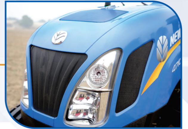
फ्यूचर स्टाइलिंग AFT के साथ