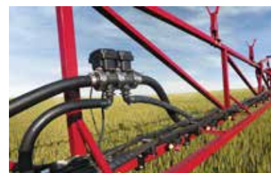
Tecnologia de aplicação