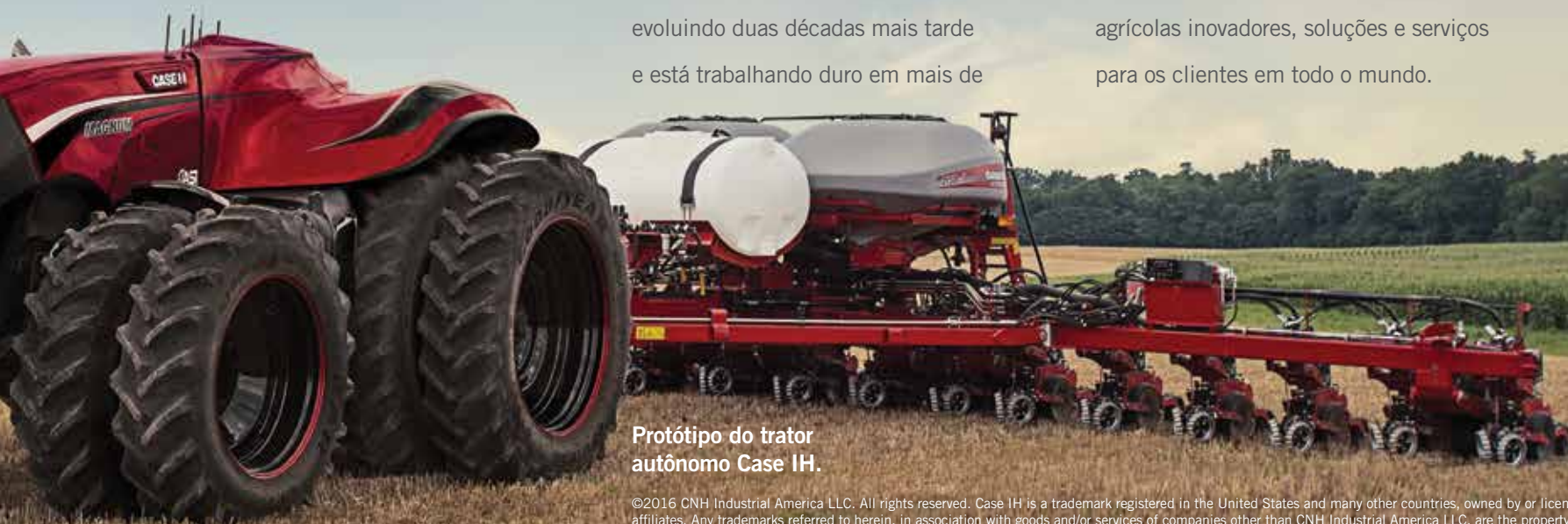
Protótipo do trator autônomo Case IH.

O aniversário de 175 anos da Case IH é um testemunho de muitos anos de qualidade, perseverança e progresso. É também uma ocasião para refletir sobre os nossos princípios orientadores de engenharia inovadora, poder eficiente e design agrônômico - uma filosofia que continua a conduzir a nossa inovação no futuro com emocionantes novos conceitos como o trator autônomo Case IH. Estamos ansiosos para os próximos cento e setenta e cinco anos, para trazer produtos agrícolas inovadores, soluções e serviços para os clientes em todo o mundo.