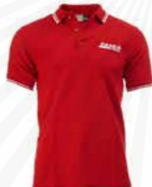
Pikétröja i bomull 260:- kr.