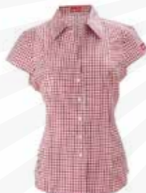
Rutig damblus 850:- kr.