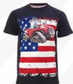
Herr t-shirt 210:- kr.