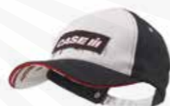
Keps med Case IH-logga 70:- kr.