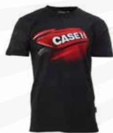
Premium t-shirt 210:- kr.