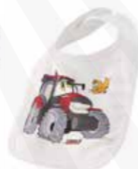
Haklapp till bebis 150:- kr.