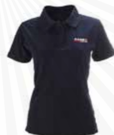
Dampiké 200:- kr.