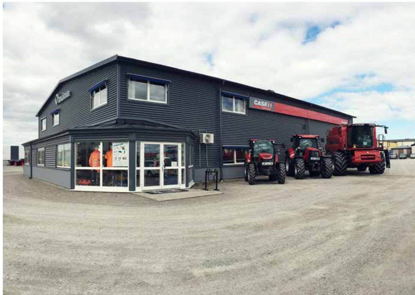
Axima i Lidköping