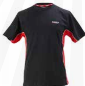
Tvåfärgad herr t-shirt 225:- kr.