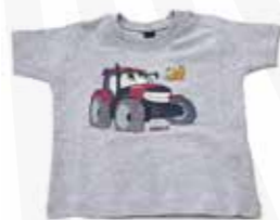
T-shirt till bebis 180:- kr.