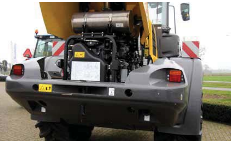
De 6,7 liter grote FPT NEF-motor met maximaal 197 pk en maximaal 950 Nm koppel gaat volgens New Holland erg efficiënt met diesel om. Tevens zichtbaar het hooggeplaatste contragewicht en de grote bodemvrijheid.