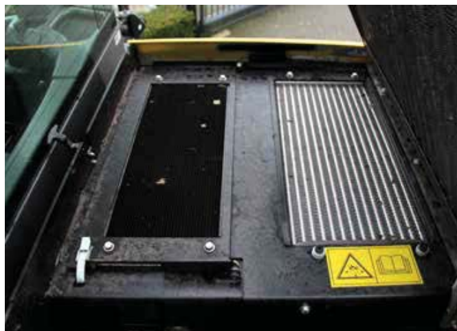
Vlak achter de cabine en voor en boven de motor ligt het koelpakket met standaard omkeerventilator. Door deze positie ervaren gebruikers minder vervuilde radiateurs.

Voor dagelijkse routines en het onderhoud maakte New Holland de motorkap elektrisch bedienbaar achter een afgesloten klepje. Hierdoor heb je alleen met de contactsleutel toegang tot de massasleutel, de brandstof- en AdBlue-tanks en verschillende filters. Dan is ook de motor bereikbaar die in de lengte in de kont van de wiellader ligt. Vlak achter de cabine en voor en boven de motor ligt het koelpakket met standaard omkeerventilator.