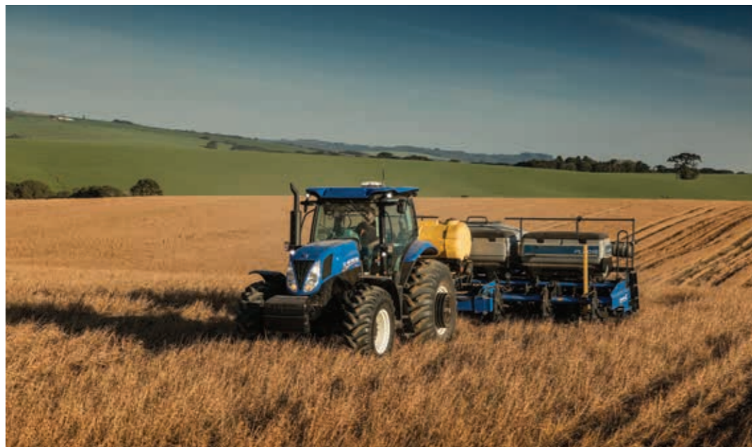
Eixo Classe IV, projetado para proporcionar resistência.

Durante as manobras de cabeceira e transporte, ative o Terralock™ e deixe que o seu T7, através do gerenciamento automático, escolha o momento ideal para ligar e desligar a tração e o bloqueio.